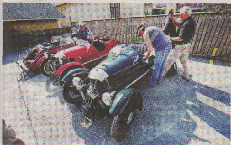
TREHJULING. Många av Morganbilarna i Karlskrona har bara tre hjul.