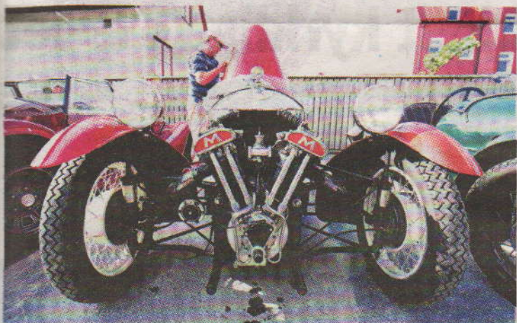
TRADITION. Tillverkaren bygger fortfarande sina bilar med samma typ av framhjulsfjädring som för 70 år sedan.